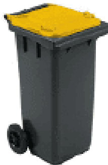
Bac 2 roues 360 L