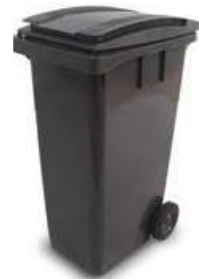
Bac 2 roues 360 L