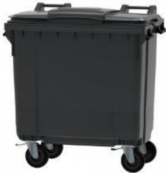
Bac 4 roues 770 L