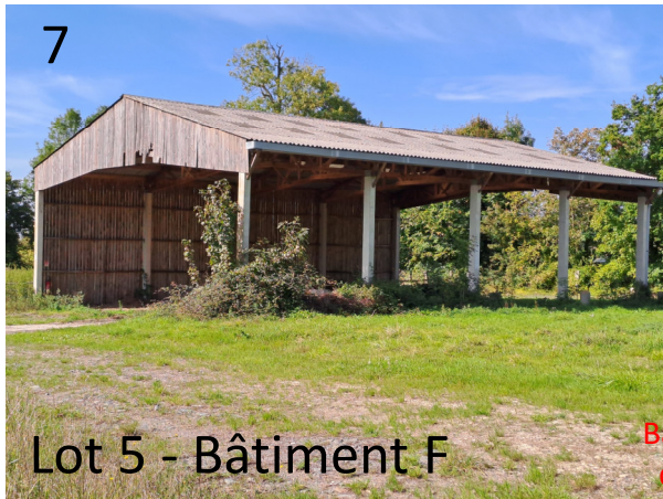
Lot 5 - Bâtiment F