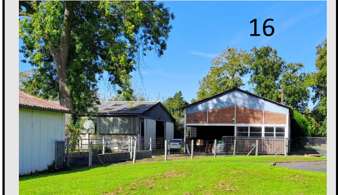
Lot 7 - Bâtiment I