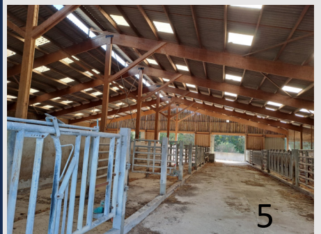
Lot 2 - Bâtiment A